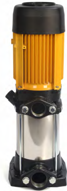
Tabla de características