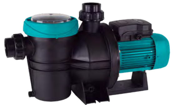
Tabla de características